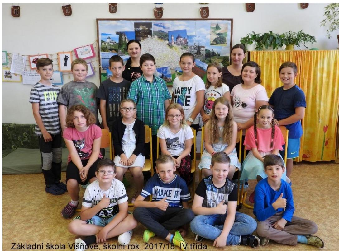
Základní škola Višňové, školní rok 2017/18, IV. třída