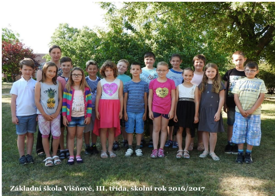
Základní škola Višňové, III. třída, školní rok 2016/2017